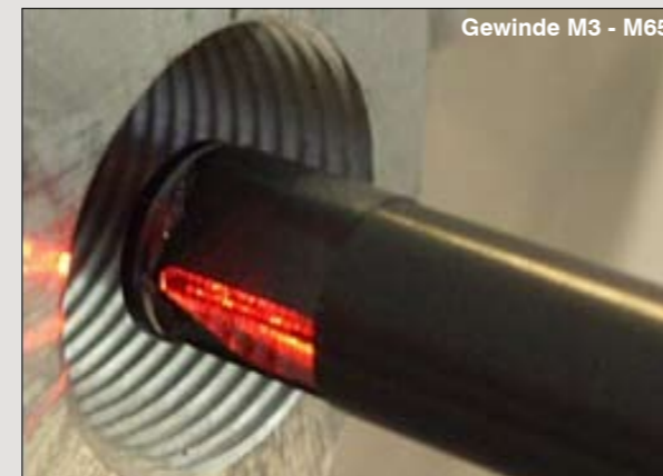
Gewinde M3 - M65